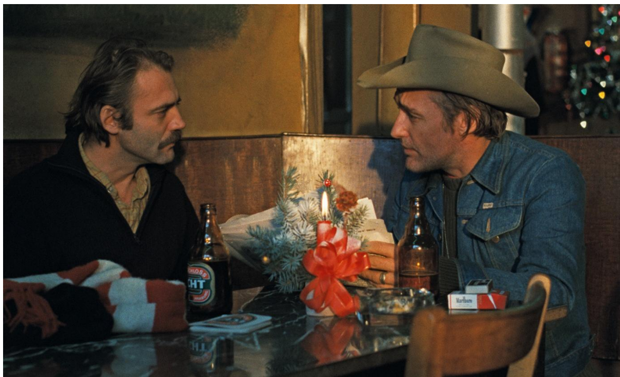
Bruno Ganz e Dennis Hopper in L'Amico americano di Wim Wenders

Titolo originale Der amerikanische Freund . Produzione Germania Ovest, 1977- 121 Min VM 14 Visto censura n. 71206 del 29/11/1977