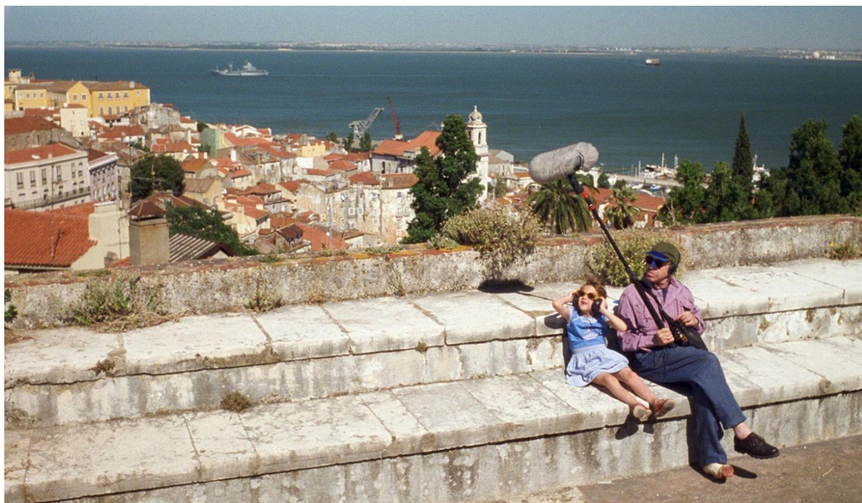
Rüdiger Vogler in Lisbon Story di Wim Wenders

Titolo originale Lisbon Story . Produzione Germania, 1994 - 104 Min FILM PER TUTTI Visto censura n. 90066 del 23/03/1995