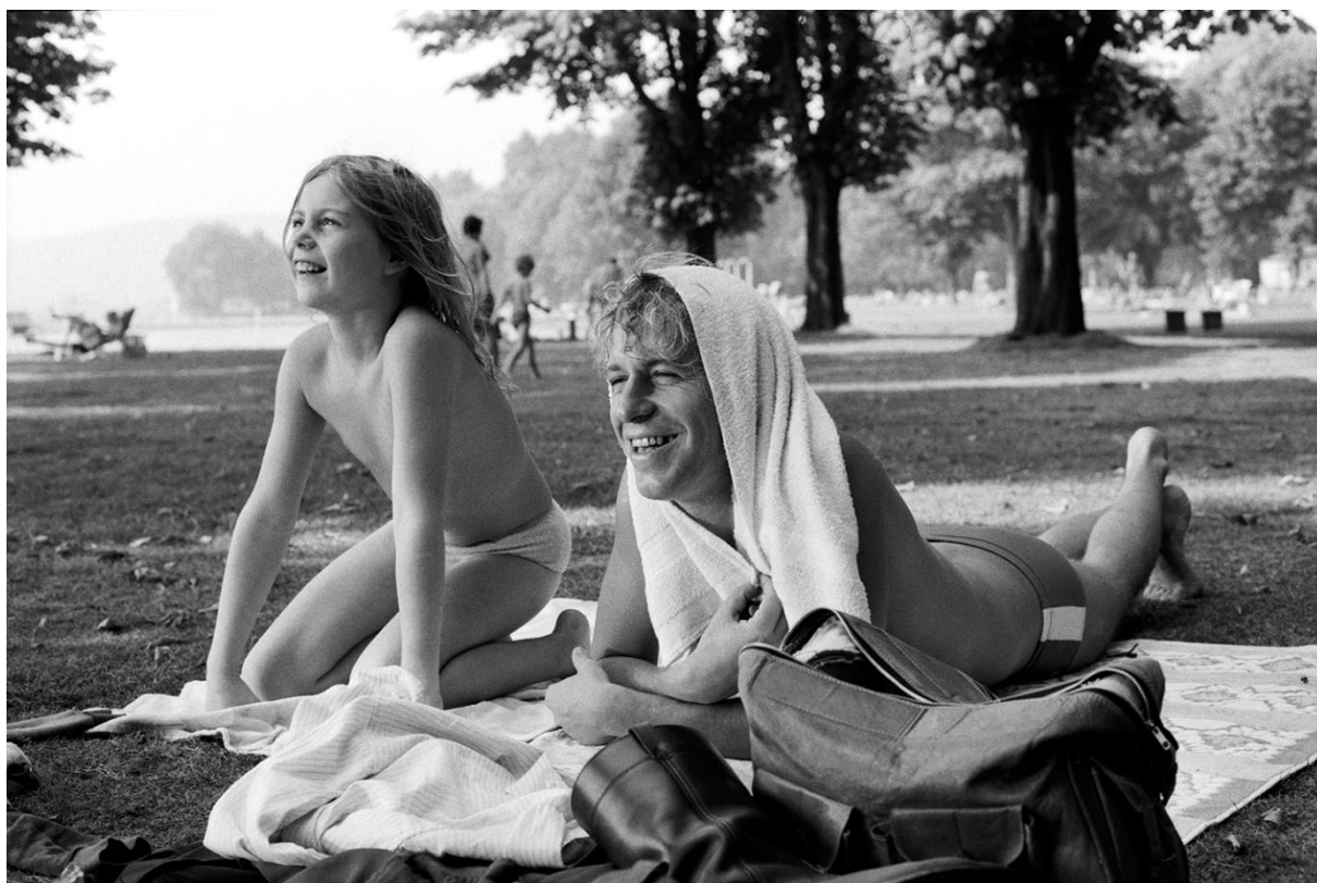
Rüdiger Vogler e Yella Rottländer in Alice nelle città di Wim Wenders

Titolo originale Alice in den Städten . Produzione Germania Ovest, 1974 – 108 Min FILM PER TUTTI Visto censura n. 76381 del 18/03/1981